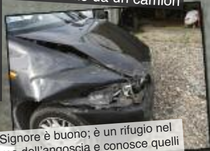
Il Signore è buono; è un rifugio nel giorno dell'angoscia e conosce quelli che confidano in Lui. Nahum 1:7